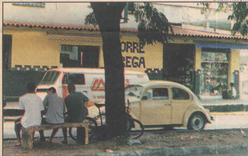
Na avenida José Rato, pequenas lojas e bares

Quando às indústrias, a única a atuar no bairro é a usina de concreto Concrevit. Conforme explicações da assessoria de Tribunação da Prefeitura Municipal da Serra (PMS), a sua contribuição mensal do ISS está estimada em R$ 6 mil.