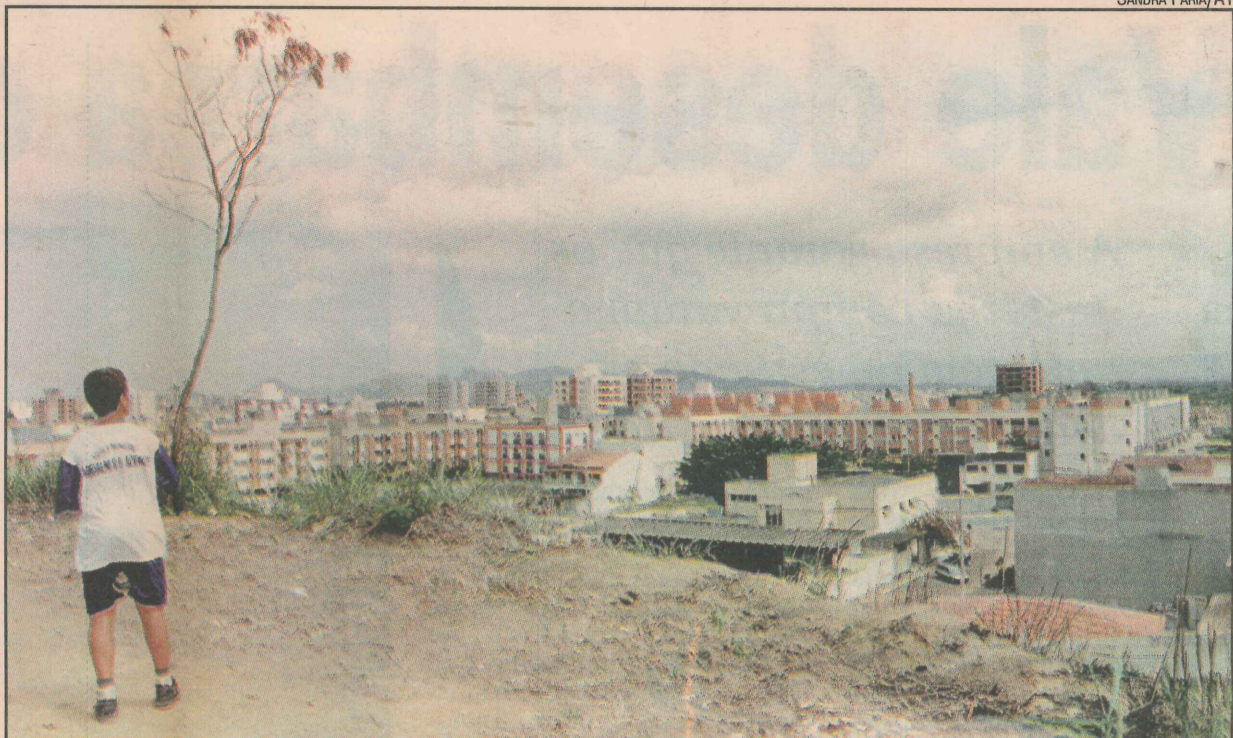
De um lado, os prédios de Jardim Camburi. Do outro, o morador de Bairro de Fátima