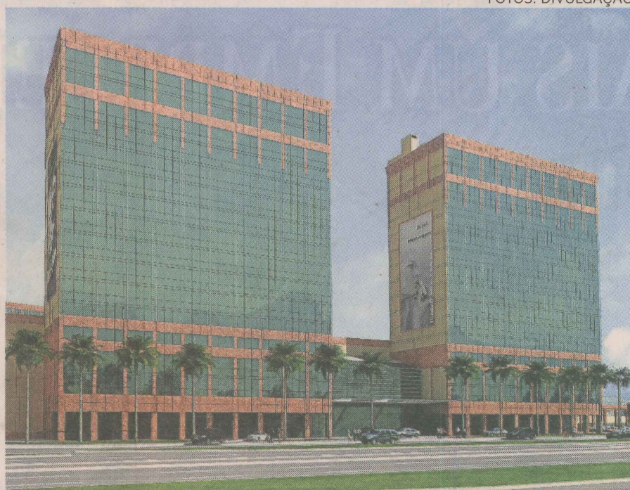
NOVOS CENTROS. Shopping Mestre Álvaro, na Serra, deverá ser inaugurado em outubro de 2011. Já as obras do Moxuara, em Cariacica, começam no ano que vem

C&A, Riachuelo, Marisa, Americanas, Etna e Ricardo Eletro já estão com contratos fechados