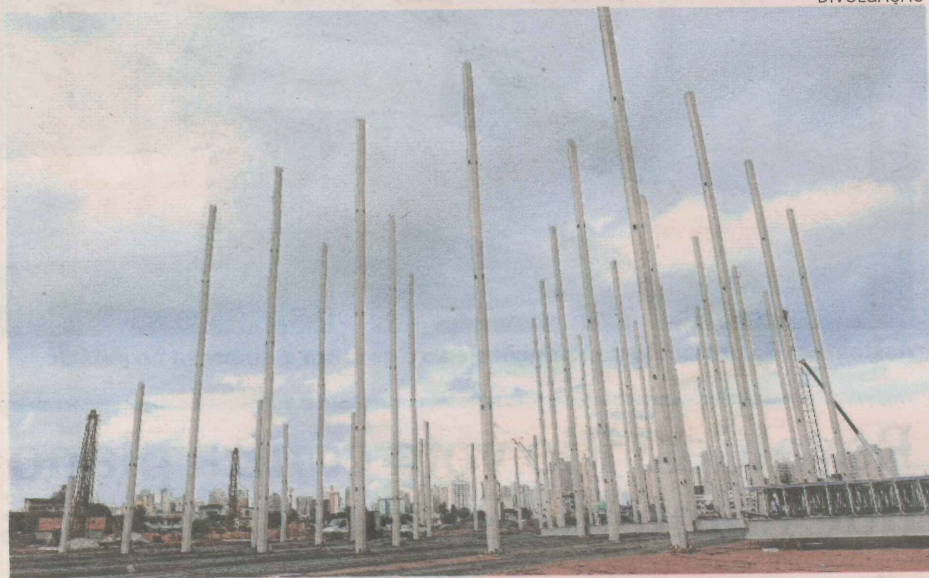
Primeiras colunas do empreendimento, perto da UVV, estão sendo instaladas