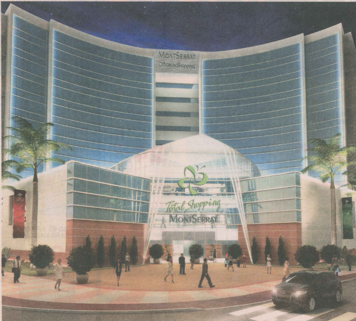
PROJEÇÃO MOSTRA como será o Shopping MontSerrat, que está sendo construído em Laranjeiras