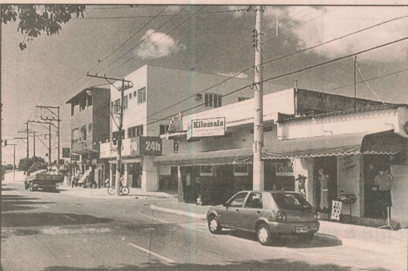
A avenida Região Sudeste concentra a maioria das lojas