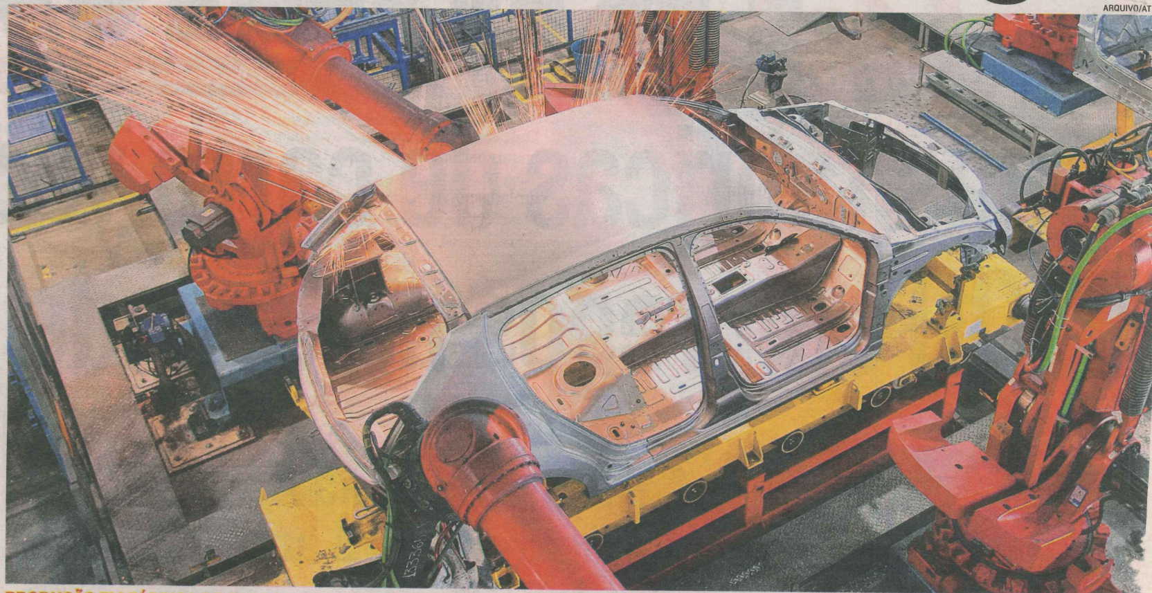
PRODUÇÃO EM FÁBRICA DE CARRO: investimento em montadora cria oportunidades de empregos, renda e receitas para o Estado e municípios

“Eles nos pediram uma área de 30 mil metros quadrados. Estamos buscando para ver qual é o melhor local para esse empreendimento. Certamente é um investimento que vai trazer muitas oportunidades para a Serra, mas também estamos avaliando os impactos para a instalação para não prejudicarmos as áreas já habitadas.”