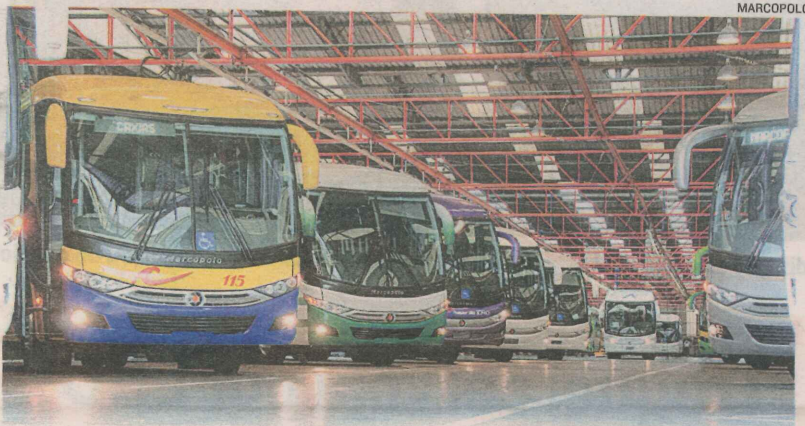
ÔNIBUS DA MARCOPOLO: empresa vai criar 300 vagas na operação