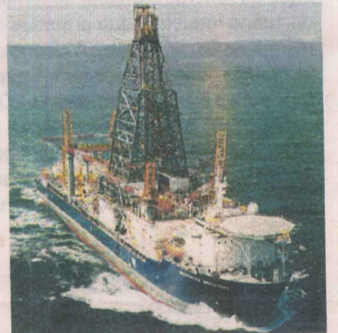
SONDA: aprovação da Petrobras

Projeto deve se concretizar até o final do ano com investimento de empresa do Rio para as indústrias de petróleo e gás e portuária