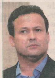
NEUCIMAR FRAGA, prefeito de Vila Velha

"Esse tipo de ação é importante para fortalecer a democracia. É possível realizar todas as ações propostas"