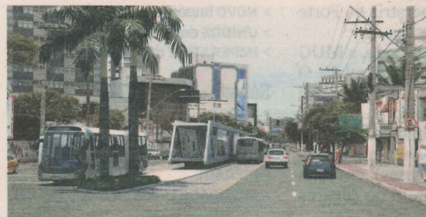
CORREDORES EXCLUSIVOS para ônibus estão entre as obras prioritárias até 2015

"Mobilidade urbana é fundamental. A construção da Quarta Ponte vai deslocar parte do grande fluxo da BR-262 para a BR-101"