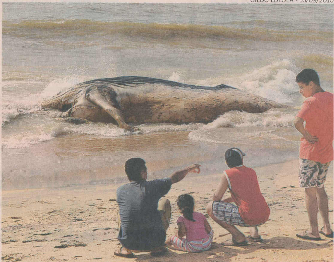
CENA COMUM. Na semana passada, uma jubarte apareceu morta na Barrinha, na Barra do Jucu