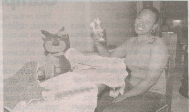
APARECIDA: talento ajudou durante desemprego