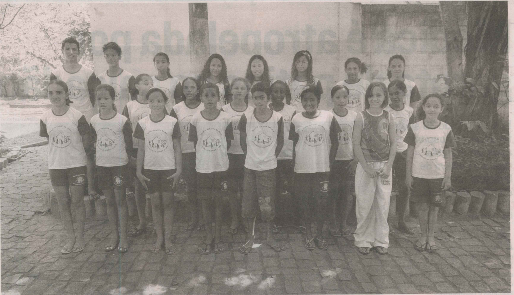
CRIANÇAS DO CORAL SALLY PAGE: grupo vai se apresentar no próximo dia 15 no bairro, com músicas do tema "Natal ao redor do mundo"

A TRIBUNA COM VOCÊ EM BALNEÁRIO DE CARAPEBUS