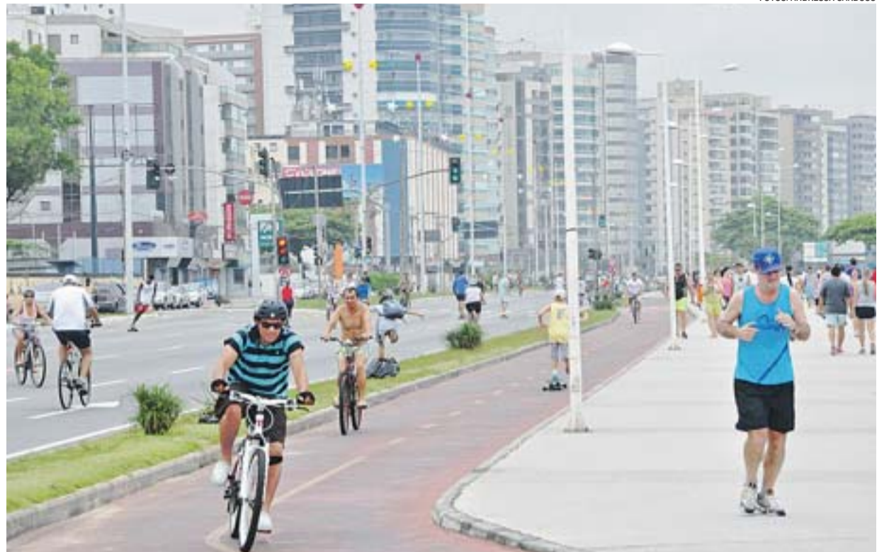
CICLISTAS E PEDESTRES se divertem na ciclovia, calçadão e na avenida liberada para o lazer em Camburi