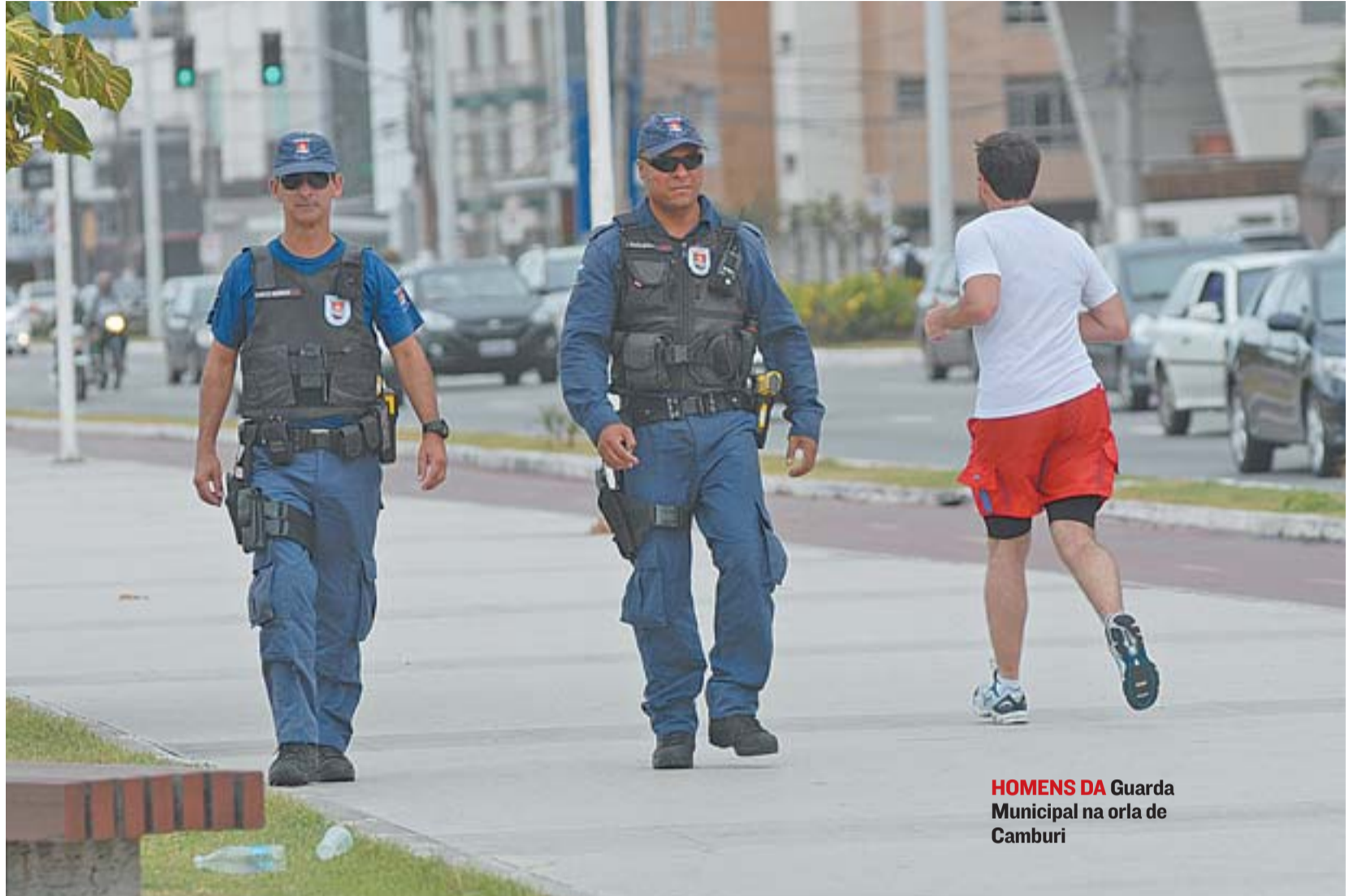
HOMENS DA Guarda Municipal na orla de Camburi