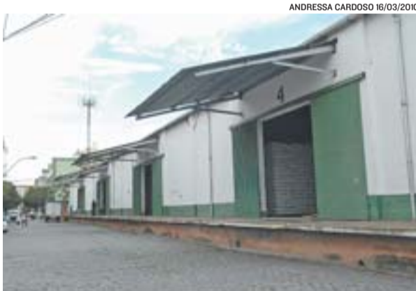
ANDRESSA CARDOSO 16/03/2010