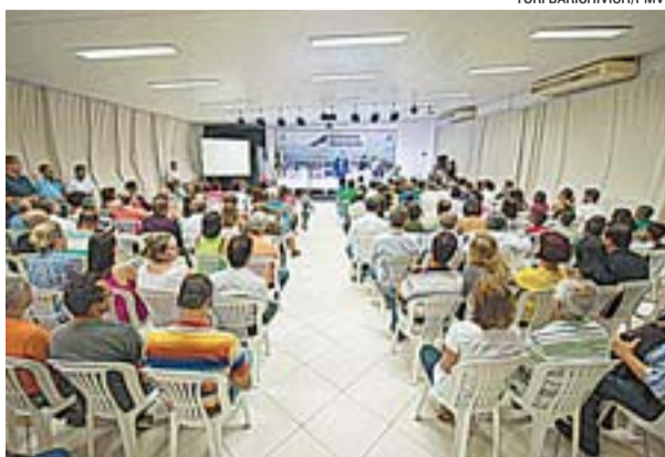
ENCONTRO DO GABINETE Itinerante aconteceu em Jardim da Penha e reuniu diversos moradores da regional 9