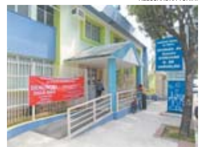
UNIDADE de Jardim da Penha