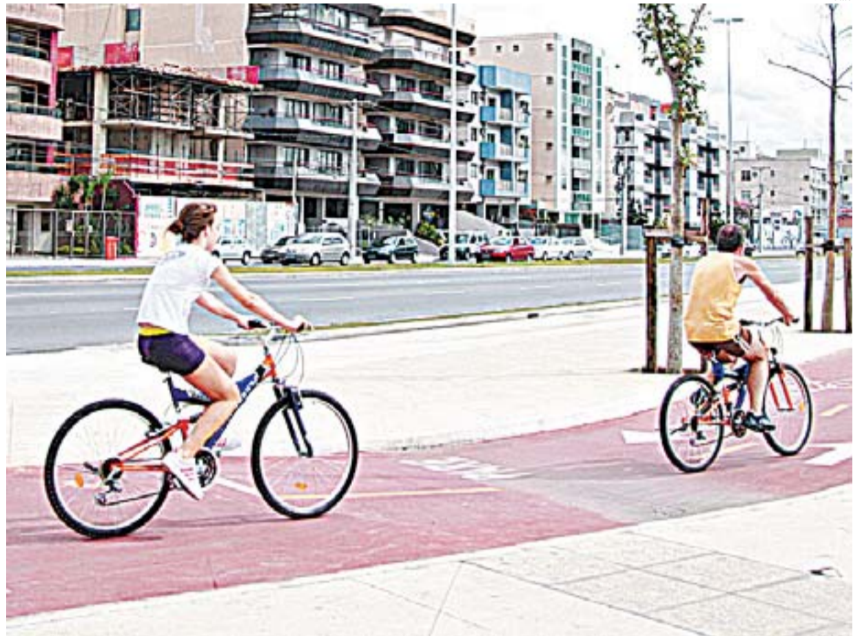
CICLISTAS NA ORLA DE CAMBURI: obras do novo trecho de ciclovias começam no final de 2014

SKATISTA EM CAMBURI: PRATICANTES do esporte já contam com uma área reservada na orla para realizar suas manobras com segurança