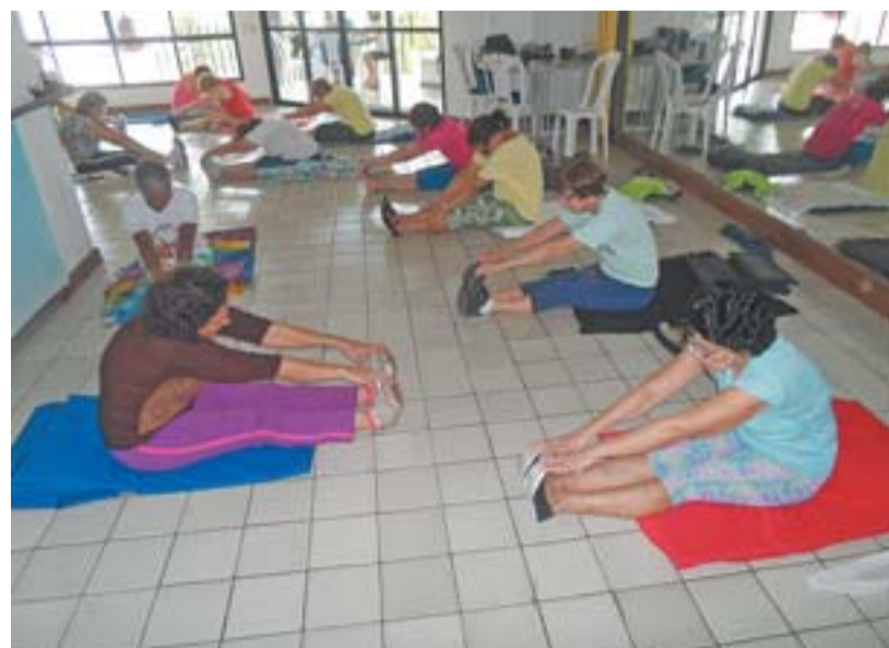
AULAS DE alongamento estão entre as atividades físicas