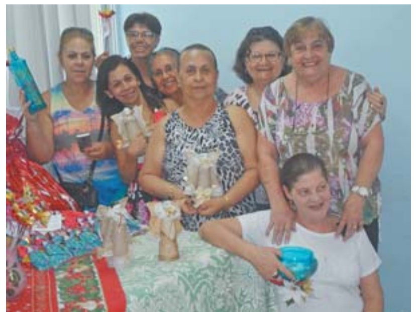
GRUPO ARTE E VIDA , da Unidade de Saúde de Jardim da Penha

“É muito bom ver e contribuir para a melhora da saúde das pessoas. Muitas chegam aqui deprimidas e ficam curadas, alegres, interação, fazem amizades e aprendem a fazer coisas lindas. Fico muito feliz por fazer parte de tudo isso”, contou a voluntária.