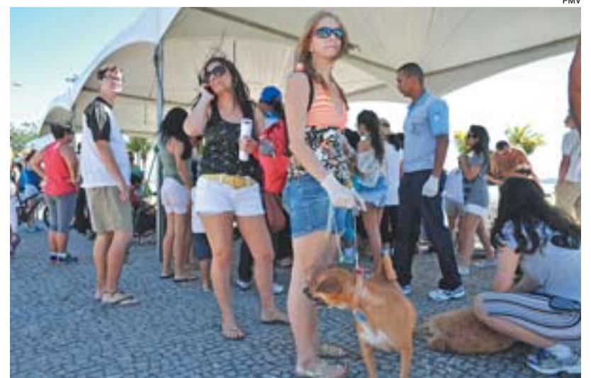
FEIRA DE ADOÇÃO DE ANIMAIS: candidatos passam por avaliação

“A única feira que eu trabalho é aqui e, pra mim, é a melhor da cidade. É uma feira muito bem fiscalizada, onde temos segurança para trabalhar, além dos fregueses, que são ótimos”, disse.