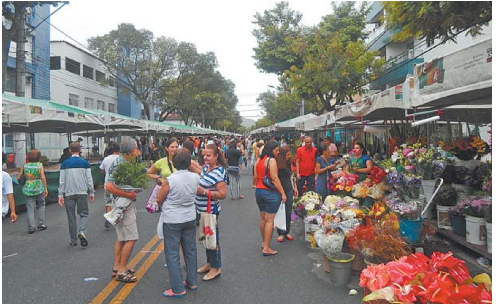
FEIRA DE JARDIM DA PENHA acontece aos sábados, tem 152 feirantes cadastrados e se destaca pela variedade de produtos vendidos no local