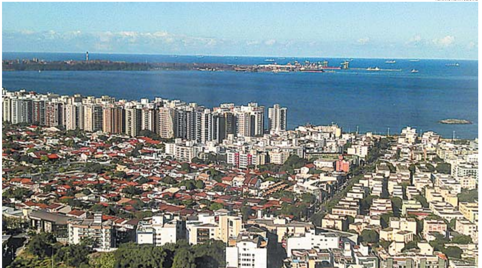
VISTA DOS BAIRROS MATA DA PRAIA E JARDIM DA PENHA: proximidade com a praia de Camburi é um dos atrativos da região

Localizado em Mata da Praia, o parque Pedra da Cebola é um dos cartões-postais do município. Frequentado por moradores de toda a