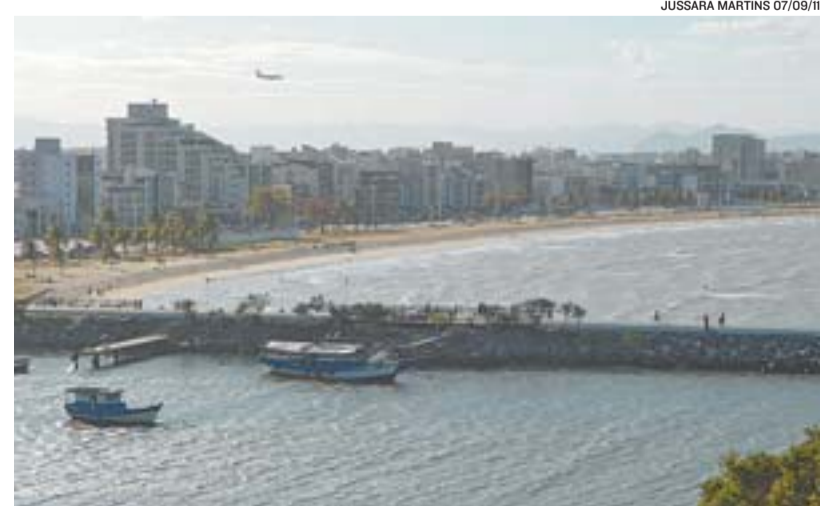
JUSSARA MARTINS 07/09/11

A PRAIA DE CAMBURI será palco de shows e campeonatos esportivos