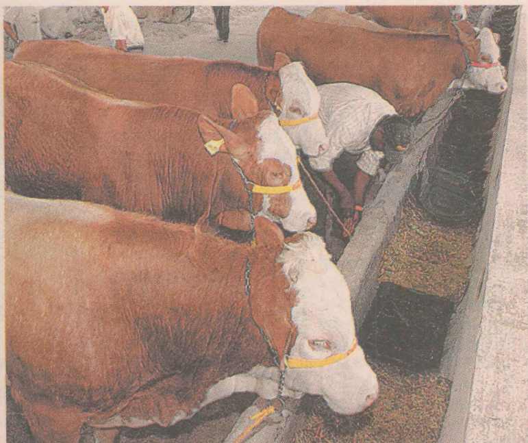
EVENTOS. Parque de Exposições serve de palco para feiras agropecuárias.