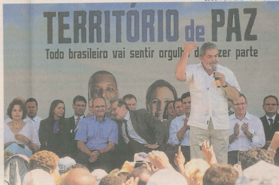
CENÁRIO ERA OUTRO. Há menos de um mês, Lula participou, em Vitória, da solenidade simbólica do lançamento do Território de Paz; projeto utiliza recursos do Pronasci, liberados em 2008

Representantes das prefeituras da Grande Vitória demonstram preocupação sobre o risco de comprometimento dos projetos que visam à prevenção da violência. Para a Polícia Rodoviária Federal, preocupa o impedimento de novas contratações de pessoal.