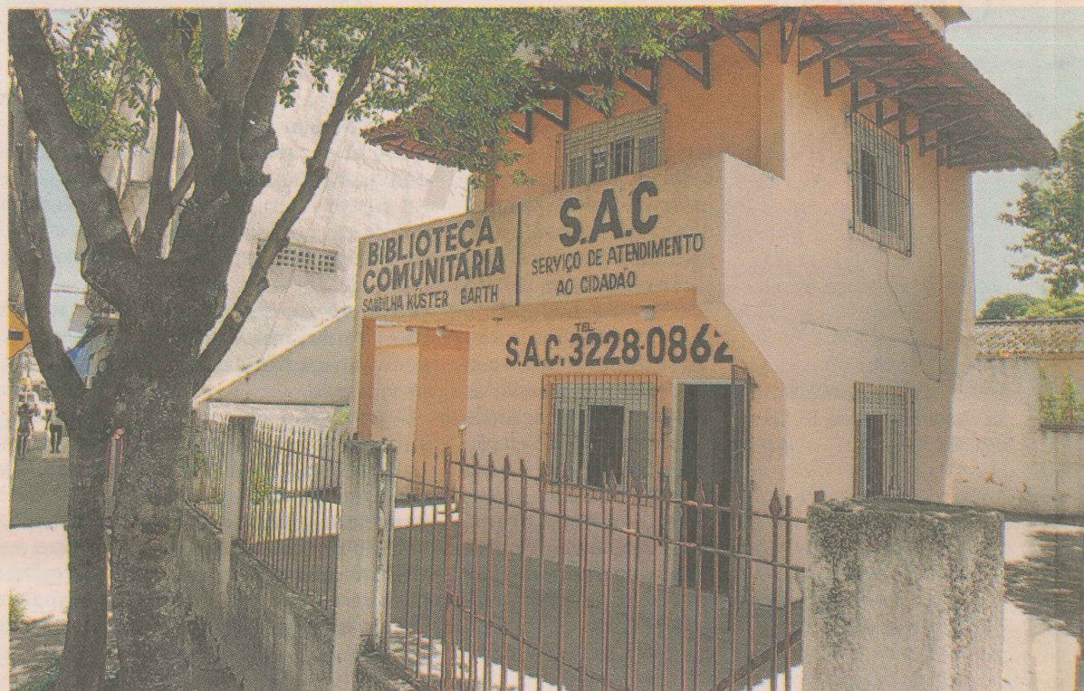
PÚBLICO. Cerca de 150 pessoas por mês são atendidas no Serviço de Atendimento ao Cidadão.

■ Horário. O SAC funciona de segunda a sexta-feira, das 8h30 ao meio-dia, e das 13h30 às 17h, no endereço Rua Alfeu Ribeiro, 907. O telefone de contato é 3228-0862.