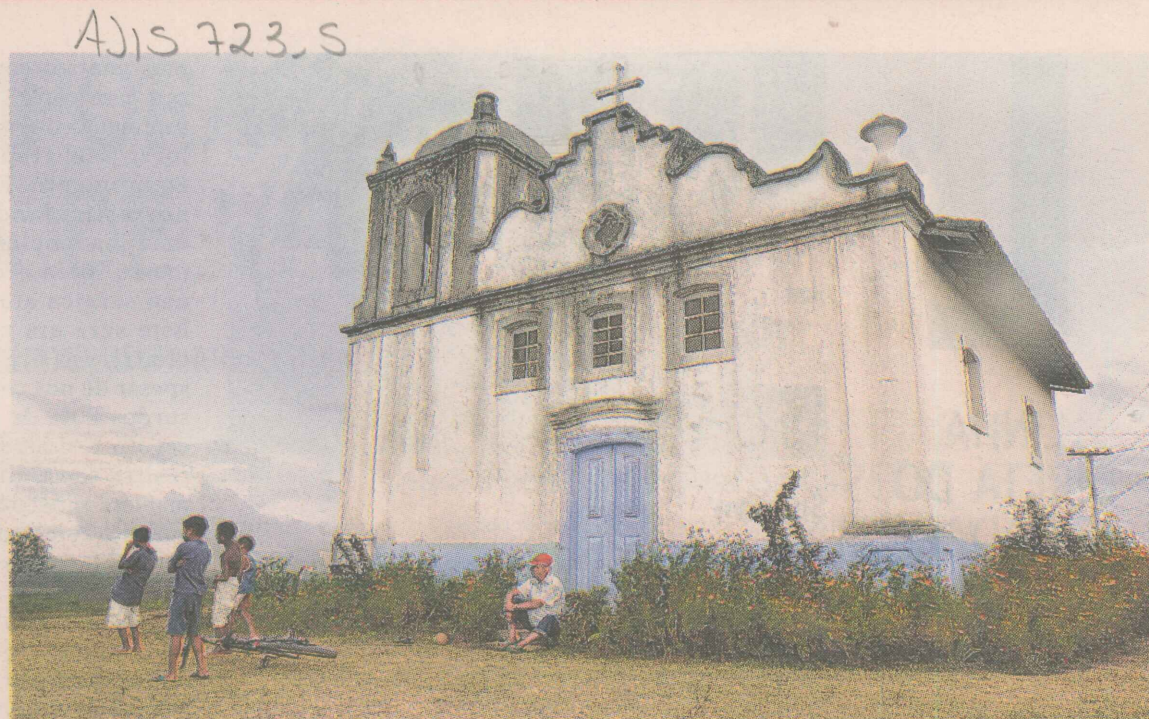
CULTURA. Capela foi tombada como patrimônio histórico estadual em 1984.

A Secretaria do Estado para Assuntos do Meio Ambiente