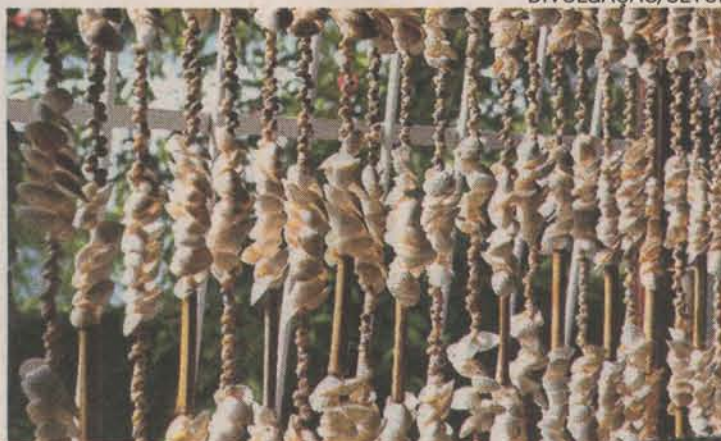
LEMBRANÇA. Destaque para o artesanato feito com conchas

■ PRAIA DO PAU GRANDE No Bairro Portinho. Na Rodovia do Sol, entre Iriri e o Centro de Piúma.