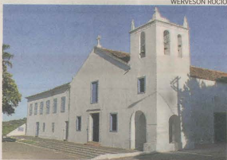
POSTAL. O Santuário de Anchieta oferece um rico acervo

De malas prontas para desbravar o Litoral Sul? Então, comece pelo Museu de Anchieta, que guarda peças do mais alto valor sacro e histórico, que pertenceram ao beato Anchieta. Construído no século XVI pelos índios tupi-guaranis, possui um exemplar do dicionário da língua dos índios, escrita de próprio punho por José de Anchieta