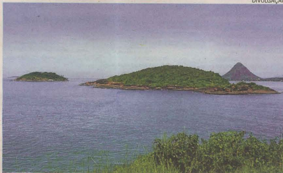
NATUREZA. A Ilha do Gambá é apenas uma das várias na região que podem ser visitadas

Se a meta é aproveitar as belas praias, opção é o que não falta. A grande pedida são os passeios de escuna até as ilhas do entorno, como a Ilha do Gambá, refúgio de aves e animais marinhos. Na ilha há ancoradouro para barcos