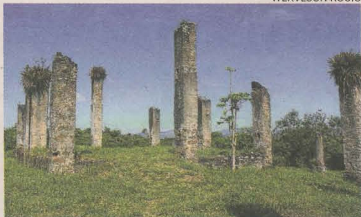
DE BARCO. Para chegar às Ruínas do Rio Salinas só navegando