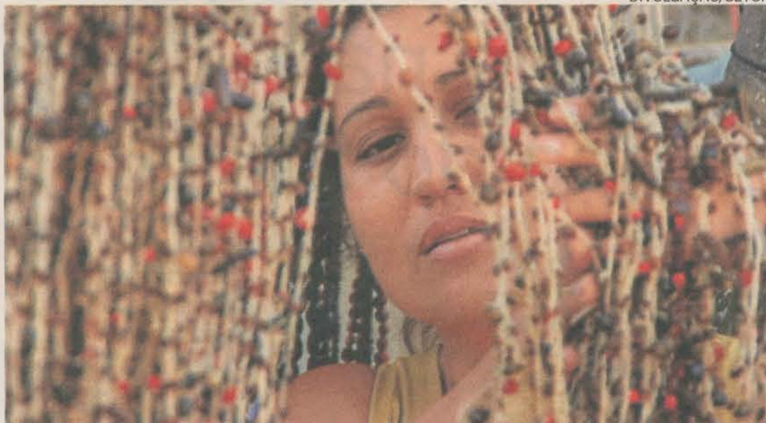
À MÃO. O artesanato de conchas em Itapemirim também é forte. É comum ver as catadoras na praia

• PRAIA DE ITAÓCA: Na Rodovia do sol, a 10 quilômetros da sede