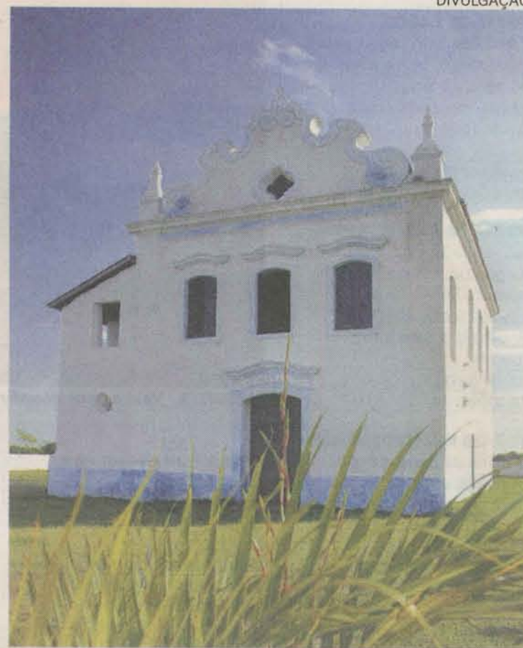
ACERVO. O Santuário das Neves foi construído pelos jesuítas

Onde ficar, onde comer, onde pescar e programação de verão de Presidente Kennedy no gazetaonline.com.br/agazeta