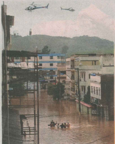
PM ajudou a resgatar moradores

Vários moradores da Sede de Alfredo Chaves foram resgatadas com ajuda de dois helicópteros da Polícia Militar, que permaneceram a tarde de ontem no município. As pessoas foram retiradas das casas ilhadas e colocadas em cestos.