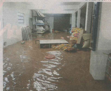
MATERIAL de construção foi um dos estabelecimentos que tiveram prejuízo