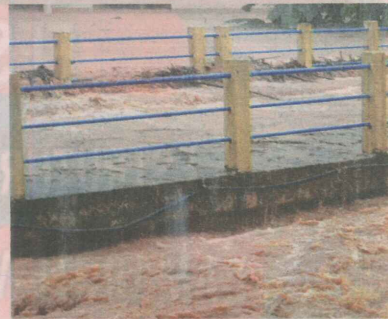
RIO chegou a 10 metros acima do nível e carregou algumas pontes