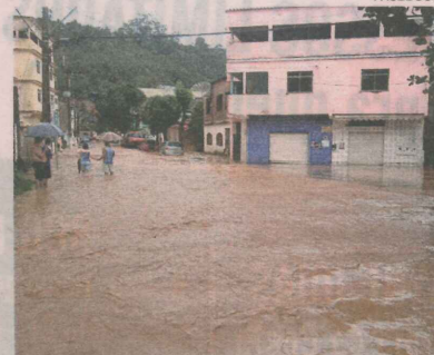
RUAS da Sede ficaram alagadas e moradores estão sem água potável