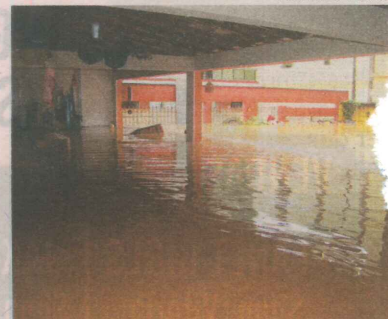
ÁGUA chegou a 1,50m e moradores tiveram que deixar suas casas