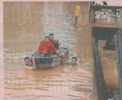
BARCOS foram utilizados para resgatar moradores de casas alagadas