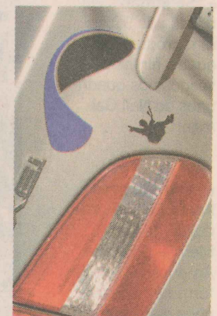
QUEM VOA É MAIS FELIZ. Os freqüentadores de Alfredo Chaves colam até adesivo de parapente no carro. Mas para subir, só jipe com tração, Fiat Uno ou Fusca. É sério!