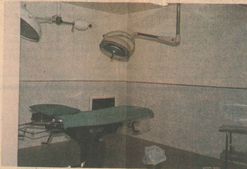
Moderno Centro Cirúrgico da Santa Casa de Misericórdia: Saúde, uma preocupação constante da Administração Municipal.