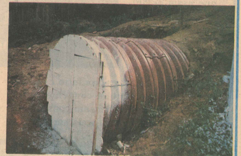
Túnel Liner: Fim das inundações no Bairro Maria das Graças.