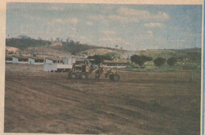
Recuperação e ampliação do Parque de Exposição

Colatina é uma cidade feliz graças um trabalho determinado e sério implantado pela administração municipal. Vale lembrar que todo esse trabalho foi possível por ter o governador Albuino Azeredo como aliado. Afinal, num "Governo Trabalhador", o "Trabalho Tudo Vence". Parabéns colatinenses.