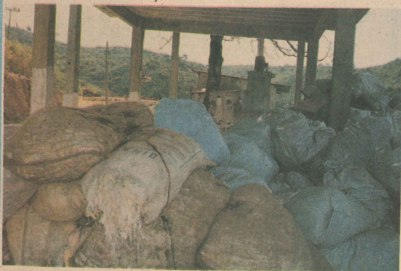
Aterro Sanitário e Coleta de Lixo: O SAMAL cuida da limpeza da cidade.