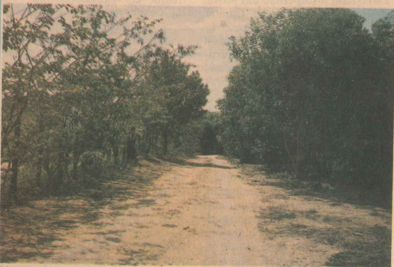
Horto Florestal: 60 mil mudas de essências naturais para tomar o município mais verde.