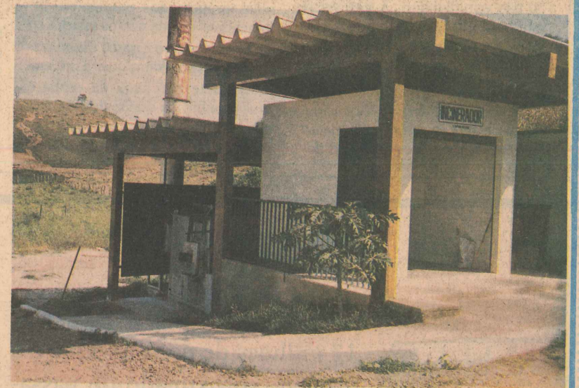
Incinerador de Lixo Hospitalar: O SAMAL também cuida da saúde do Colatinense.

No 71º aniversário da cidade o que não falta é motivo para comemorar. O programa de moradia popular já atendeu centenas de famílias e a administração municipal acaba de solucionar um impasse que envolvia o Projeto Columbia, com casas e lotes, sem atender sua função social. O Túnel Liner no bairro Maria das Graças é outra obra fundamental solucionando problemas relacionados com inundações.