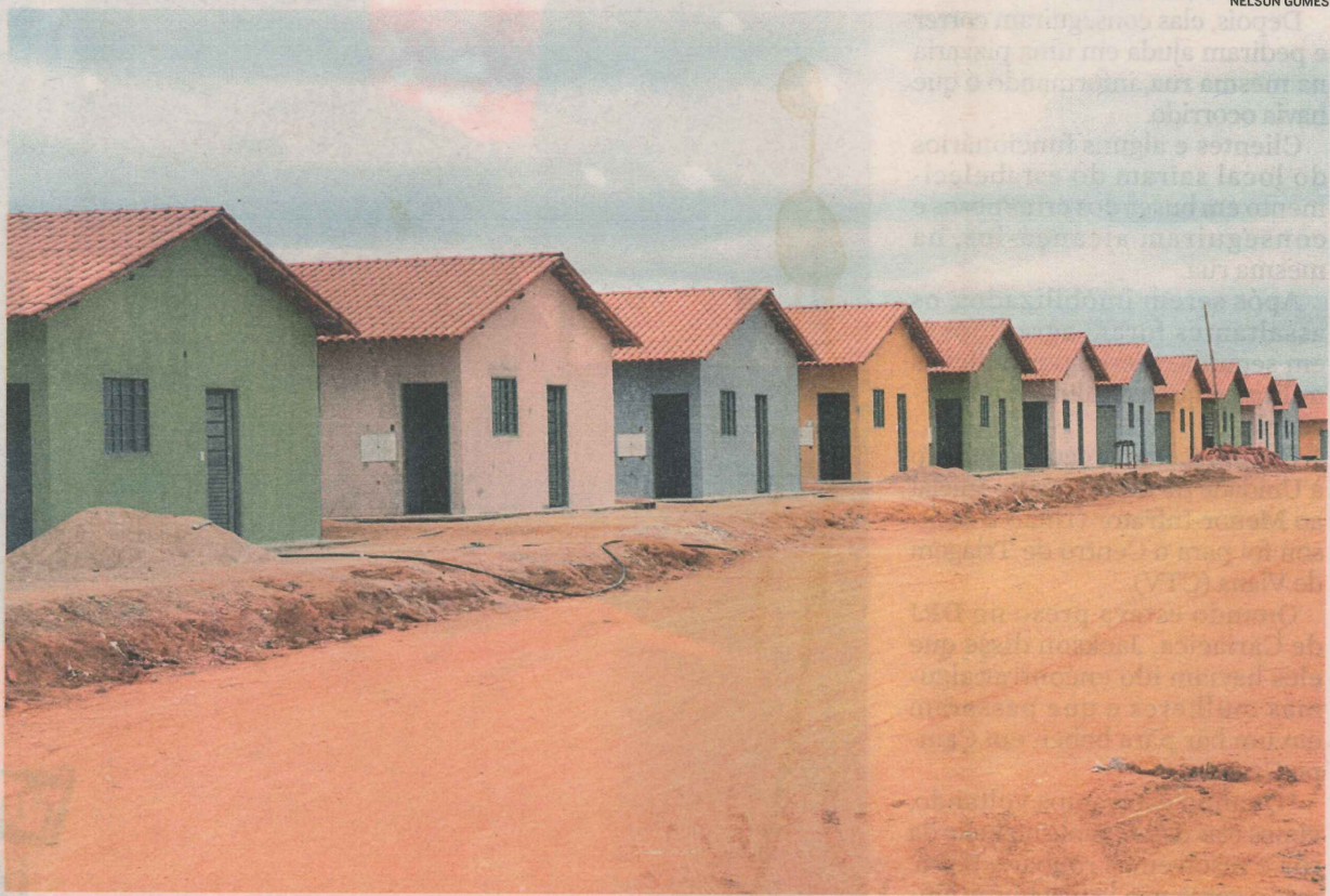
CASAS POPULARES no loteamento que vai dar origem ao bairro Parque das Águas no município

Segundo o engenheiro, três projetos públicos permitirão a criação dos bairros Parque das Águas e Ayrton Senna II e III. Já com os empreendimentos privados, surgiram os bairros Recanto dos Pássaros, Fazenda Vitalli, Bosque da Princesa e