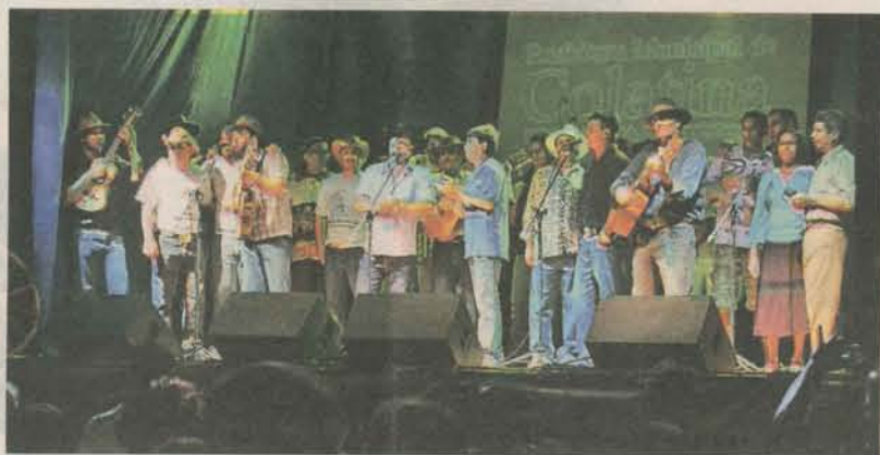
O FENA VIOLA chegou a reunir mais de 20 mil pessoas no distrito de Itapina