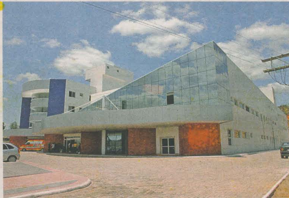
GRUPO vai abrir três novas salas de cirurgia, totalizando um investimento de R$ 4 milhões

► ALÉM DISSO, o Apart Hospital tem um corpo clínico formado por mais de 200 médicos, contemplando todas as especialidades médicas e paramédicas.