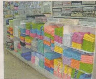
GRUPO gera mais de mil empregos

Atualmente, o grupo possui outros estabelecimentos como o Mercadão Moda Infantil, o Supermercado dos Tênis, a Megalar e a Placar Sport.