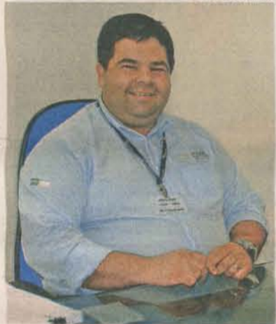
LEITE: novos pontos de venda

da sua estratégia de investir em Colatina porque o município tem forte atuação na indústria, no comércio e na vocação agrícola. Outras 12 concessionárias do grupo estão instaladas no Estado: em Cachoeiro de Itapemirim, Vila Velha, Vitória, Serra e Guarapari.