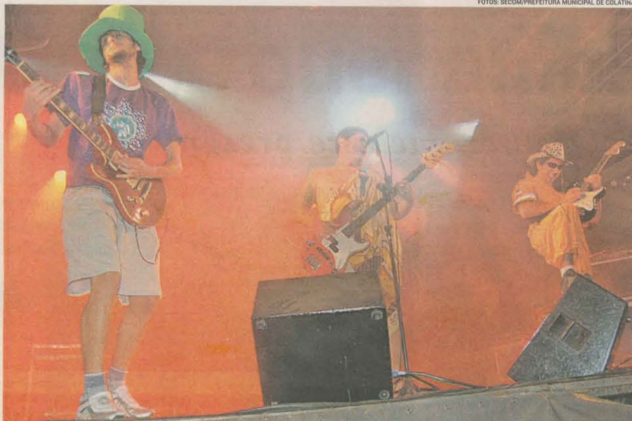
FESTIVAL DE ROCK de Colatina: evento faz parte do calendário cultural da cidade e chega este ano à sua 5ª edição