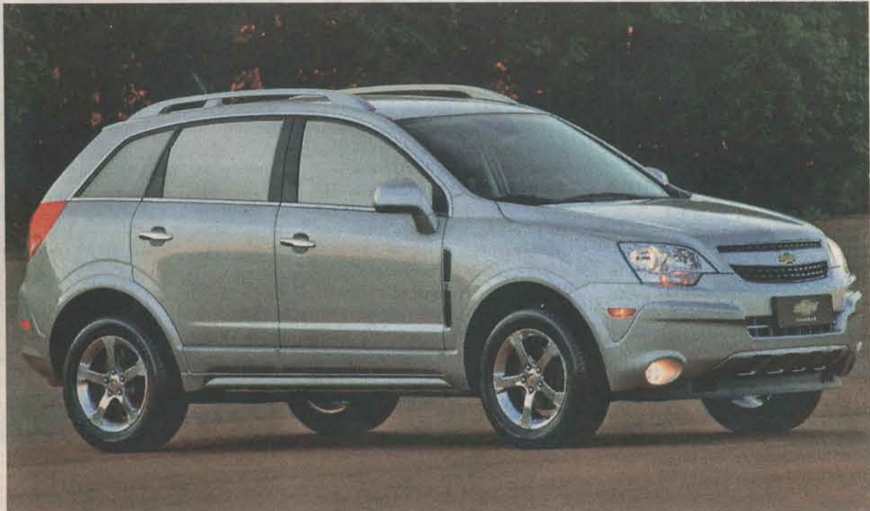
NA CVC COLATINA, há fila de espera pelo utilitário esportivo Captiva, lançado no País em meados do ano passado

Os investimentos devem girar em torno de R$ 30 mil. Além disso, está sendo estudada a implantação de um ponto de venda na região de