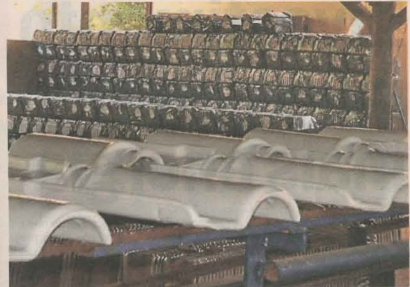
HOJE, empresa chega a produzir de 45 mil a 50 mil telhas por mês

como fonte de energia pura de queimada perfeita não agredindo o meio ambiente, recomendado por organismos de defesa ambiental.