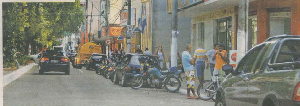
MOACYR Artemes Menegatti Junior (destaque): "As contratações são reflexo do comércio forte de Colatina"