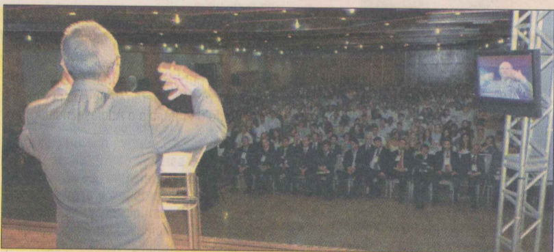
A platéia lotou o auditório no Centro de Convenções

Sobre sustentabilidade, Hartung falou das transformações sofridas no Estado e também da importância de crescer com sustentabilidade.