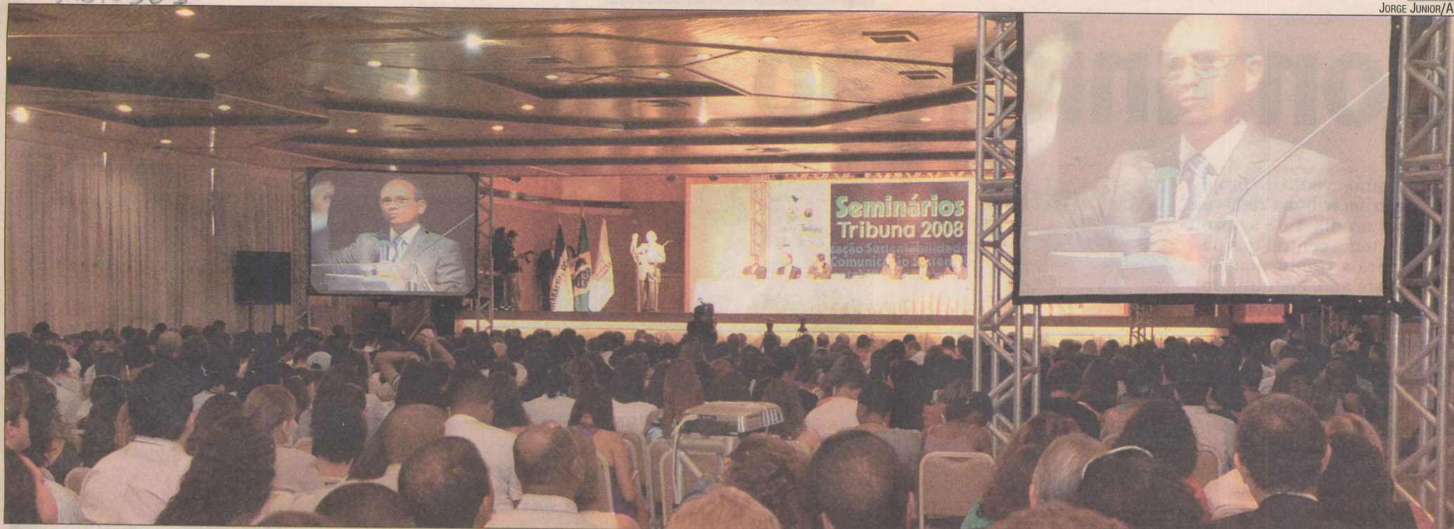
O governador Paulo Hartung falou sobre os planos na área de sustentabilidade na apresentação do primeiro seminário da Rede Tribuna neste ano