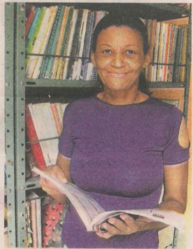
NELI: livros para a comunidade

"Quando comecei, consegui uma doação de 200 livros didáticos. Atualmente tenho mais de 500. Até adulto pega livro comigo para estudar. Esse acervo é um sucesso no bairro", completou.