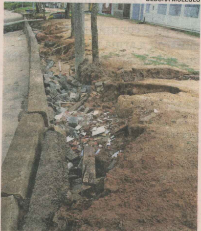
A ORLA está cheia de valas