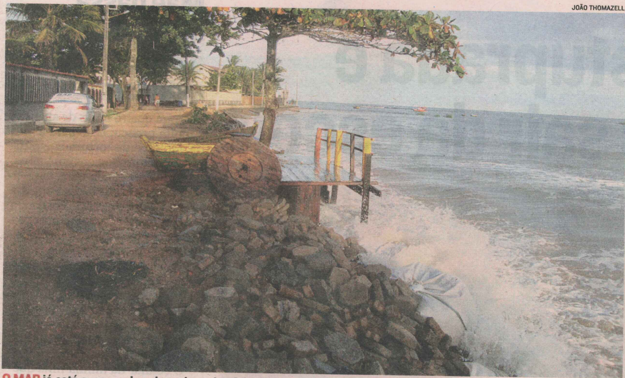
O MAR já está avançando sobre a barreira de pedras que foi colocada no local para impedir mais destruição