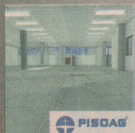
PISOAG PISOS ELEVADOS