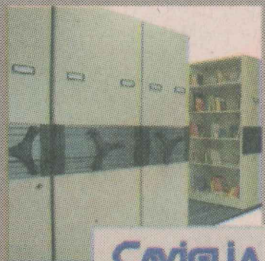
Caviglia ARQUIVOS DESLIZANTES

■ OPORTUNIDADES. O seminário terá ainda mais uma palestra sobre as oportunidades de investimento na região, das 16h15 às 18h, com representantes da CSU, Samarco, Geres, Petrobras e Secretaria Estadual de Desenvolvimento.