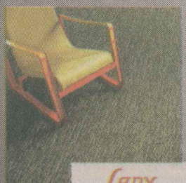
Lady REVESTIMENTOS ESPECIAIS