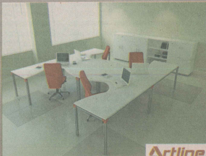
Artline poténcias inteligentes

Rua Alexandre Buaiz | 190 | Master Tower | Loja 4 Enseada do Suá | Vitória/ES | 27 3205-7976