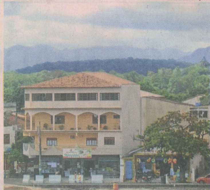
CIDADE. Anchieta vai receber altos investimentos até 2013

Outra iniciativa da companhia petrolífera é o Terminal