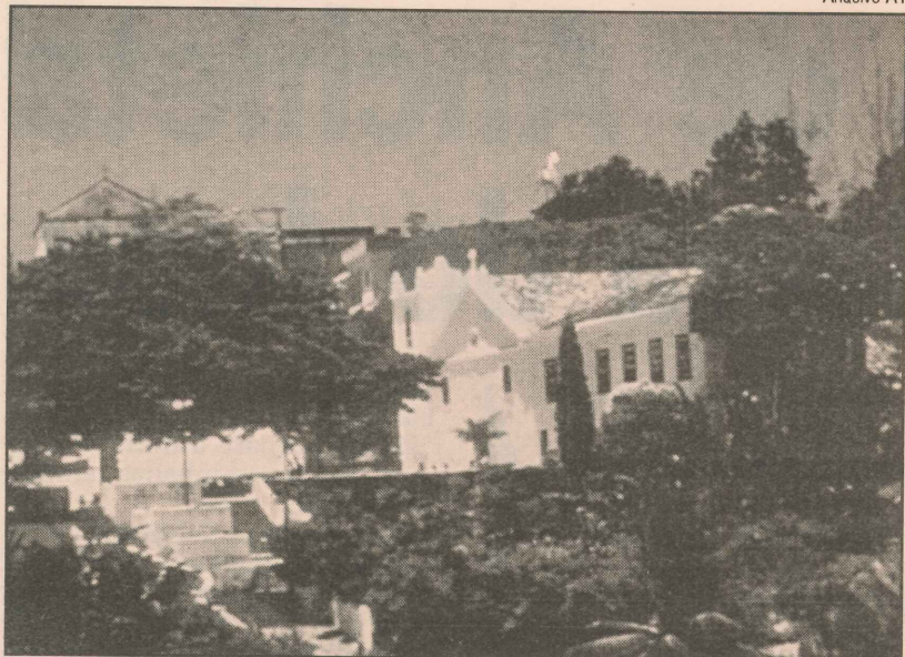
Roteiro turístico com igrejas e museu em Anchieta