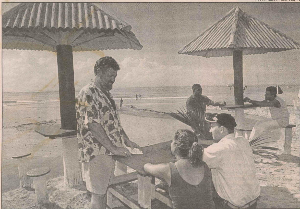
Nos quiosques da orla, turistas aproveitam para provar pratos típicos e admirar a vista

Não faltam opções de diversão no balneário, que tem sete quiosques, seis restaurantes e vários bares