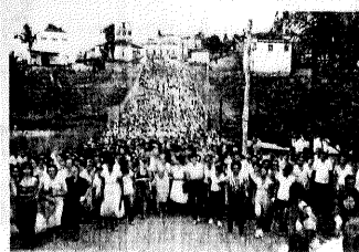
MONSENHOR Guilherme Schmitz, sua ordenação sacerdotal em 1937, em Vitória, celebração dos seus 40 anos de padre, e seu enterro, que atraiu multidão na cidade de Aracruz, em janeiro de 1983