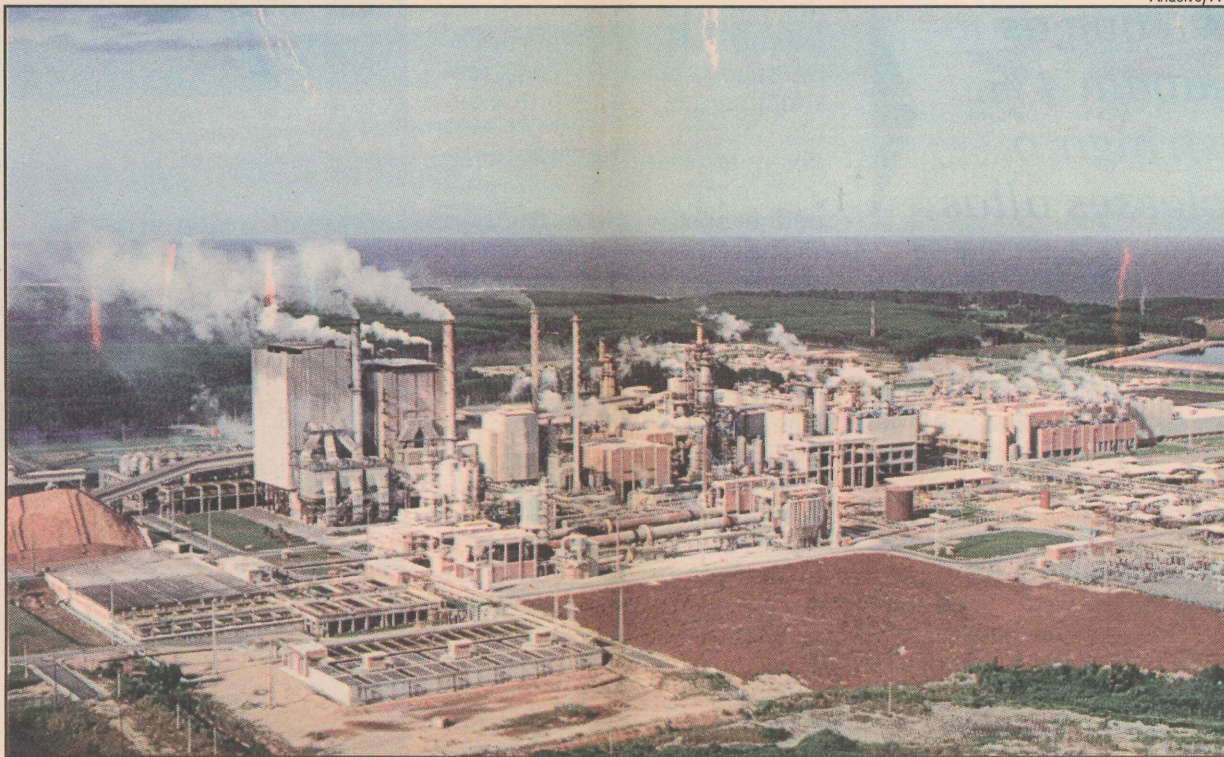
A Aracruz Celulose destina quase toda a sua produção ao mercado externo

O município abriga a maior fornecedora de celulose do mundo, que injeta R$ 200 milhões no Estado