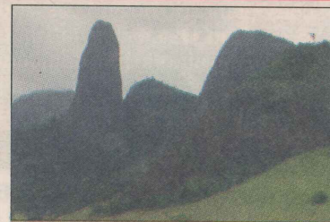
Pico do Itabira Rio Itapemirim Pedra do Caramba Pedra da Penha