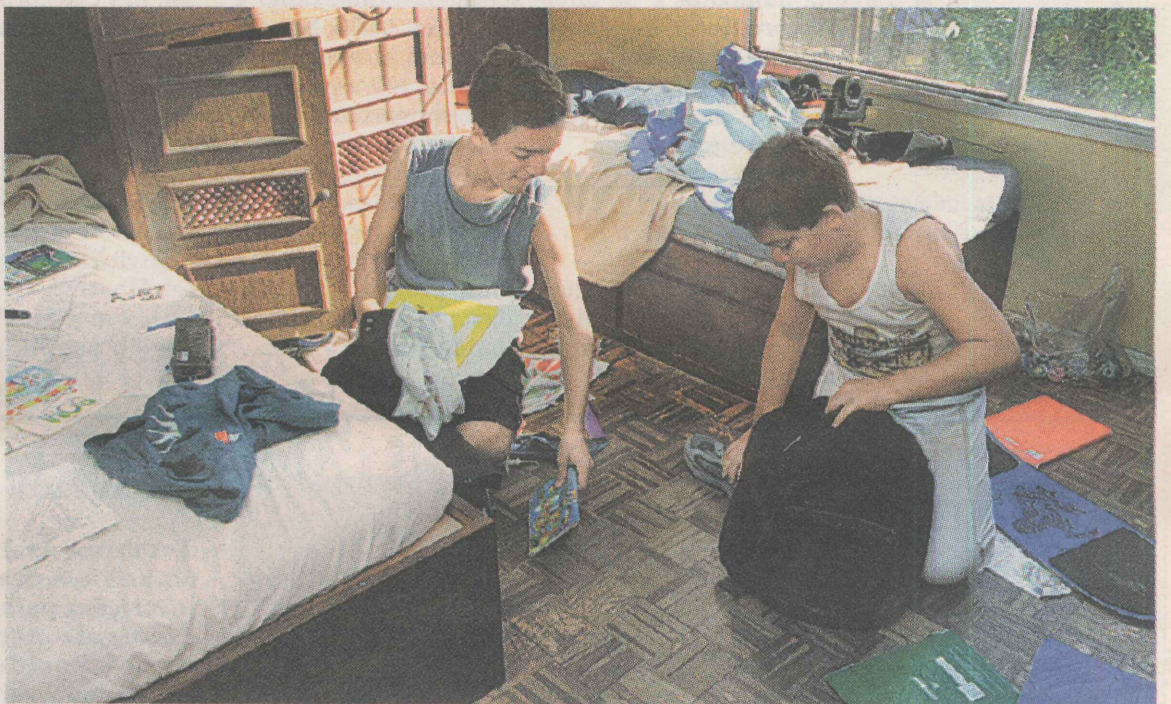
DESPESA. Peças de roupas, sapatos e brinquedos que não são usados representam dinheiro jogado fora, e ainda exigem gasto para comprar armários.

Caixas por todo lado. Roupas que você não usa ou não cabem mais entupindo o guarda-roupa. Sua casa está uma bagunça e você não acha nada. Talvez você não seja um caso tão extremo, mas ainda não sabe o custo dessa bagunça.