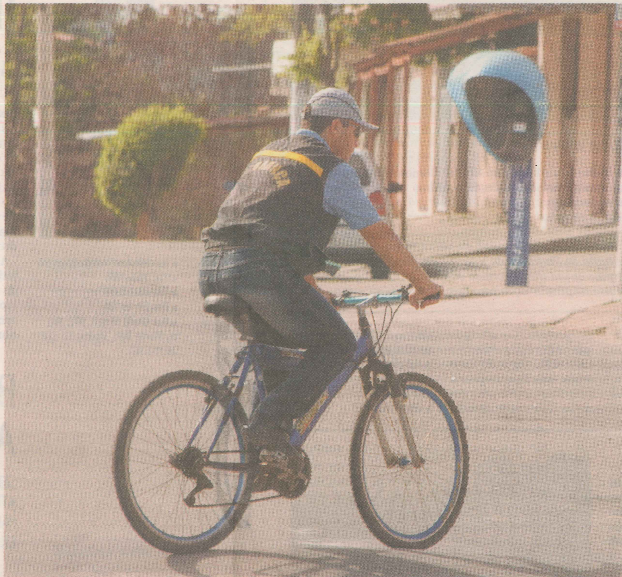
CONTROLE. Seguranças são contratados pelos moradores para vigiar comércio durante o dia e as casas à noite.