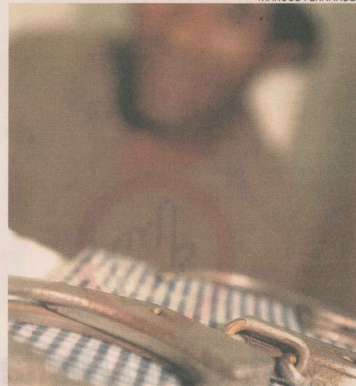
NEGAÇÃO. Homem nega as acusações, mas foi preso em flagrante porque tentou abusar de uma das filhas na segunda-feira

A mãe das crianças admitiu que o marido abusava da família. “Sofremos com isso tem 10 anos. Ele sempre foi muito agressivo. E abusou das meninas também. Denunciei outra vez, mas nada foi feito”, desabafou a doméstica.