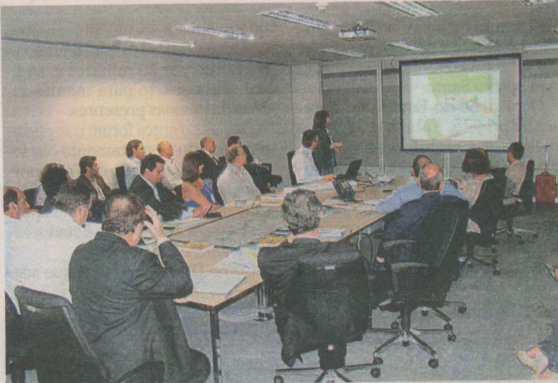
PROFISSIONAIS de Engenharia debatem projeto: oportunidades

trônica ou Eletroeletrônica. > SALÁRIO: de R$ 2 mil a R$ 3 mil.