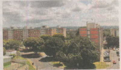
DISTRITO Federal: maiores salários