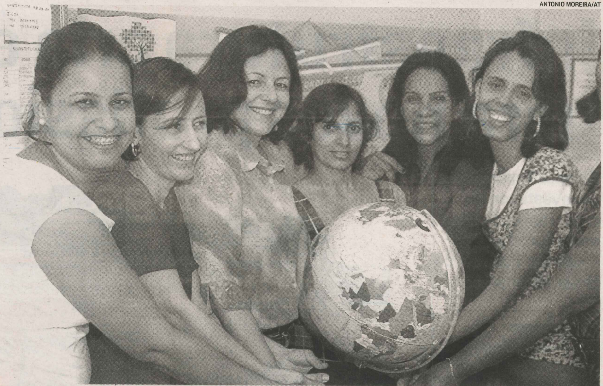
PROFESSORAS de centro de educação infantil de Laranjeiras, na Serra: remuneração maior por hora trabalhada