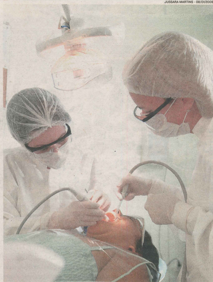
DENTISTAS atendem paciente: excesso de profissionais no mercado