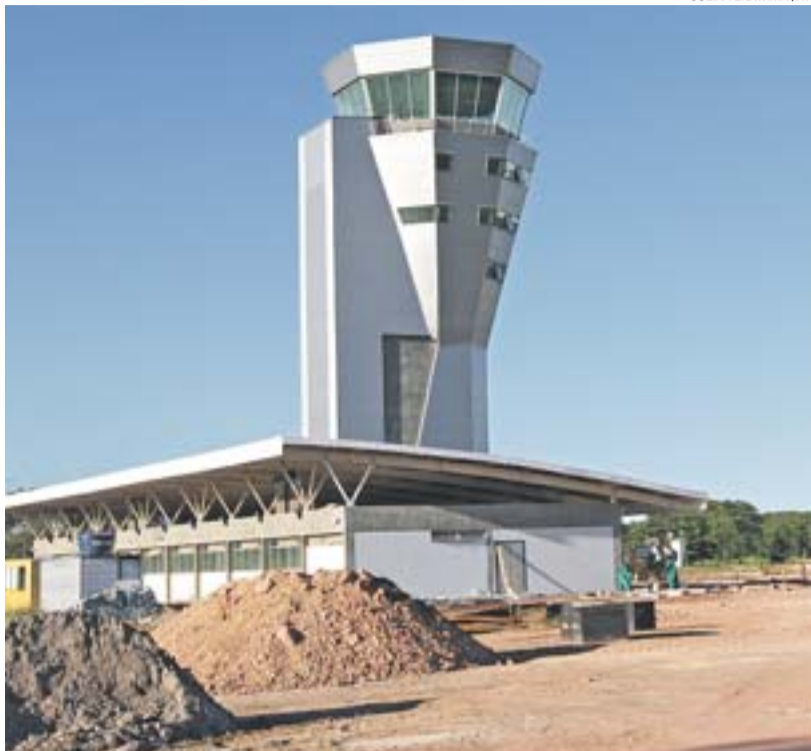
NOVA TORRE DE CONTROLE: obras civis foram finalizadas em agosto