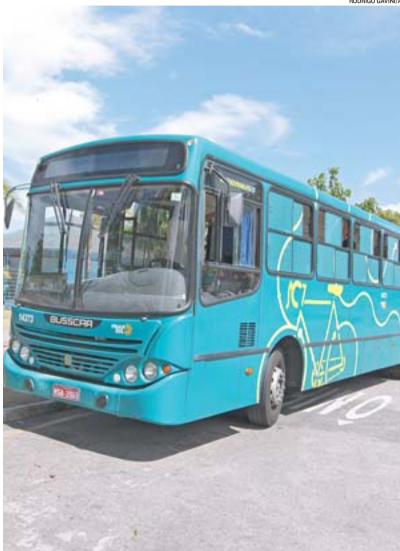
ÔNIBUS para transporte de bicicleta entre Vila Velha e Vitória