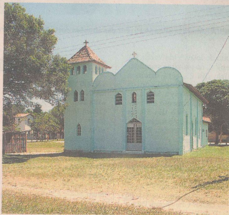
FÉ. A Capela de São Sebastião vai receber devotos e visitantes durante as festas folclóricas

Já a Festa do Alardo movimenta cerca de 40 pessoas que representam os mouros e os cristãos, em uma luta pela recuperação da imagem de São Sebastião e pela conversão dos infiéis, no caso os mouros, responsáveis também pelo seqüestro da imagem.