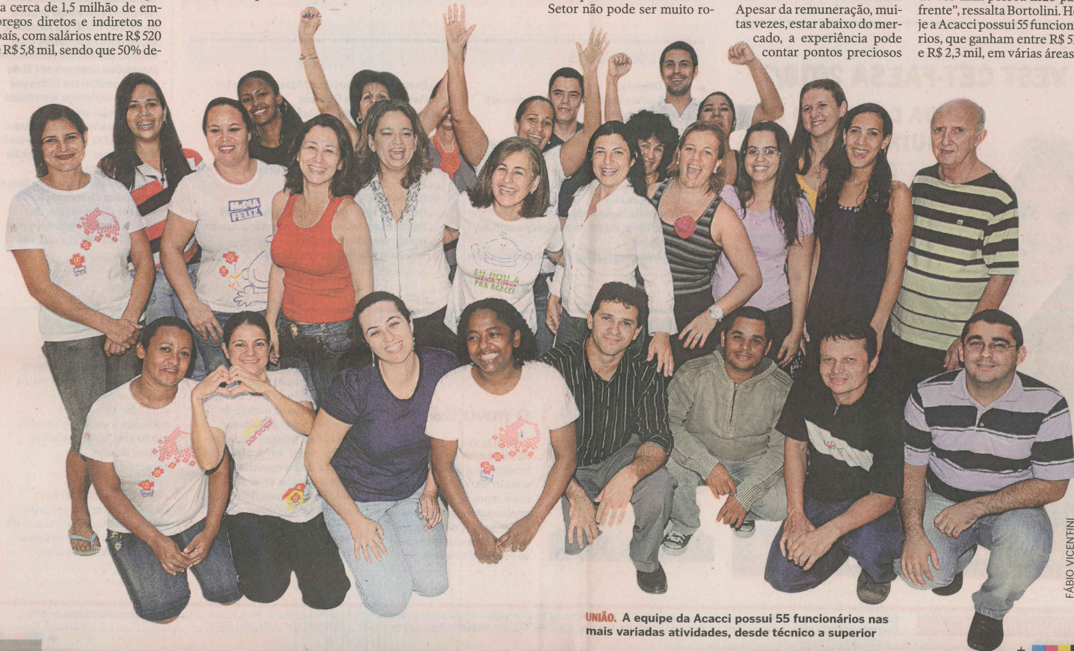
UNIÃO. A equipe da Acacci possui 55 funcionários nas mais variadas atividades, desde técnico a superior