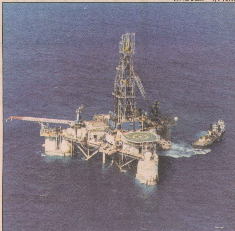
Plataforma no bloco BC-60: investimentos em descoberta

O teste no bloco BC-60 vai começar em setembro, de acordo com a Petrobras