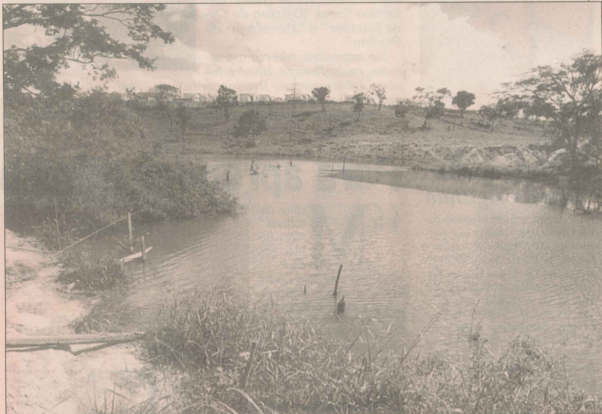
Lagoa da Cidade Continental que está sendo poluída por coliformes fecais