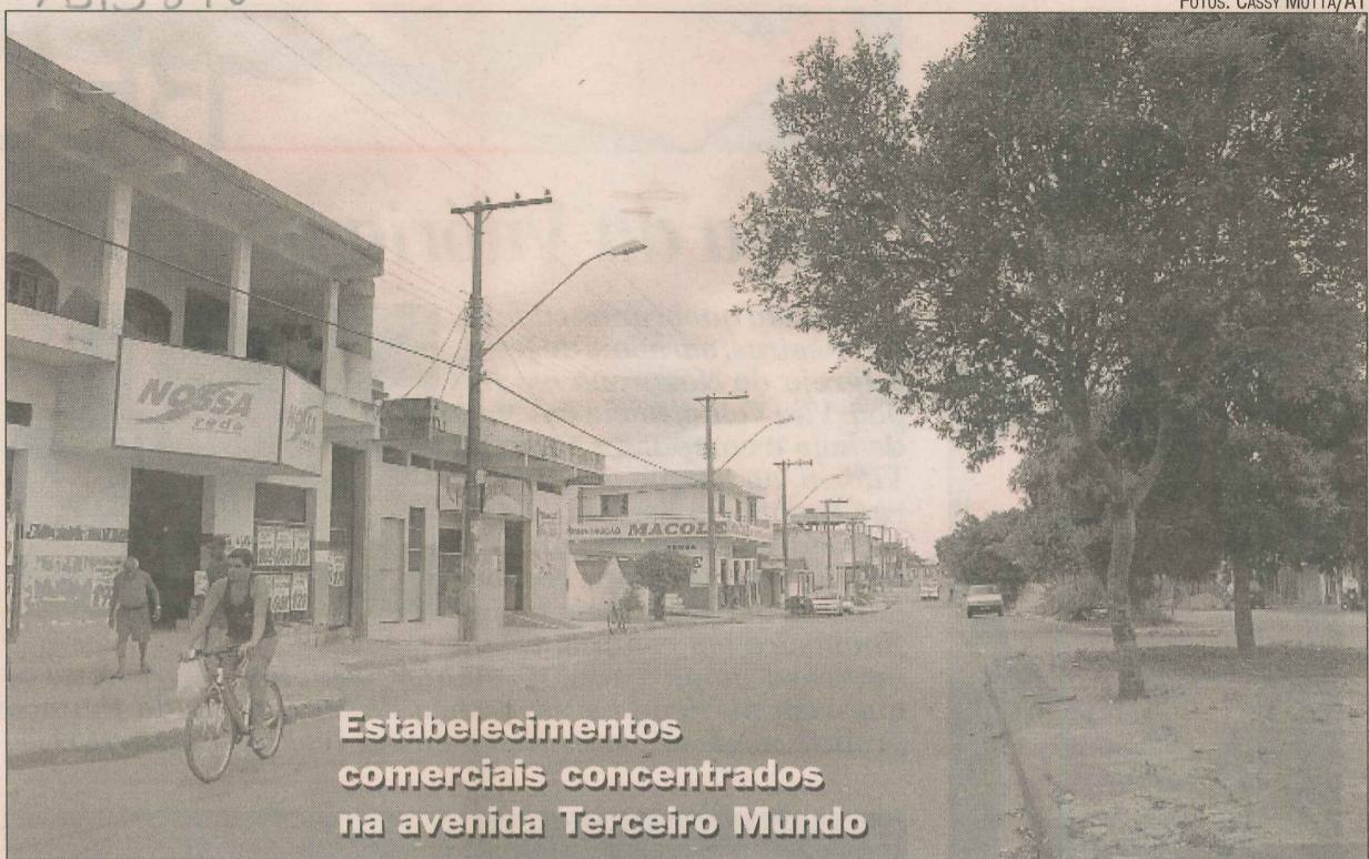
Estabelecimentos comerciais concentrados na avenida Terceiro Mundo

O pedido, segundo ele, será encaminhado às instituições financeiras, que analisarão a solicitação.