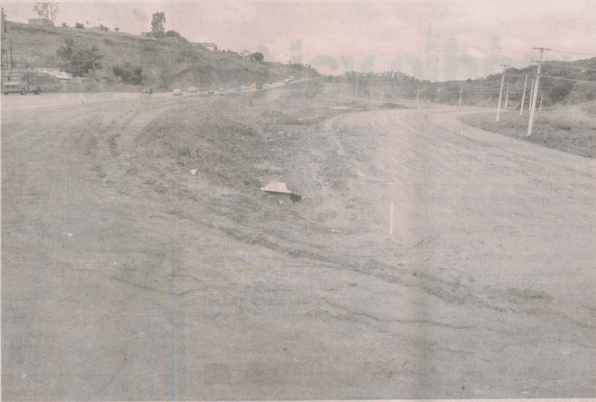
OBRAS DE CONSTRUÇÃO de viaduto na BR-101, na Serra : intervenção no local começou em maio deste ano