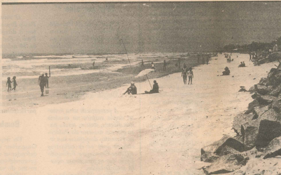
A praia é a grande atração de Conceição da Barra