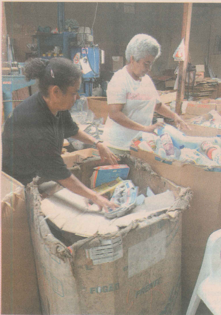
EM DOMICÍLIO. Pessoal da Ascamare busca doações na casa do doador, na região de Goiabeiras, em Vitória.

NA GRANDE VITÓRIA E INTERIOR HÁ ASSOCIAÇÕES DE CATADORES QUE RECEBEM PAPEL, JORNAL, SUCATA E PLÁSTICO. MUITAS BUSCAM O MATERIAL NA CASA DO DOADOR