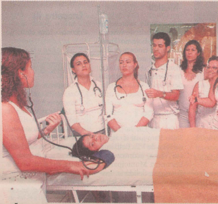
OPÇÃO. Enfermagem é um dos cursos que oferecem bolsas para quem fez o Enem.

Ségundo a Associação de Moradores, o sistema de esgotamento sanitário construído pela Cesan há 20 anos não suporta mais a demanda. Págs. 4 e 5