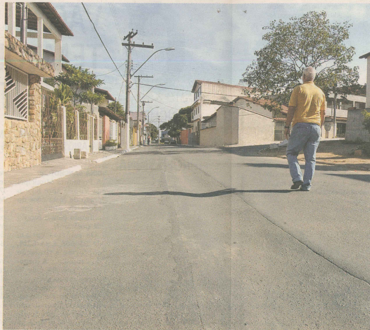
ALAGAMENTOS. O asfalto ficou rebaixado por onde foram abertas valas para confecção da rede pluvial. Por isso, quando chove, as ruas ficam cheias de poças.

SEGURANÇA. Outro problema enfrentado pelos moradores de Eurico Salles é a falta de segurança. O bairro é quase um condomínio e, por isso, não é muito movimentado, tanto em relação ao trânsito quanto ao comércio.