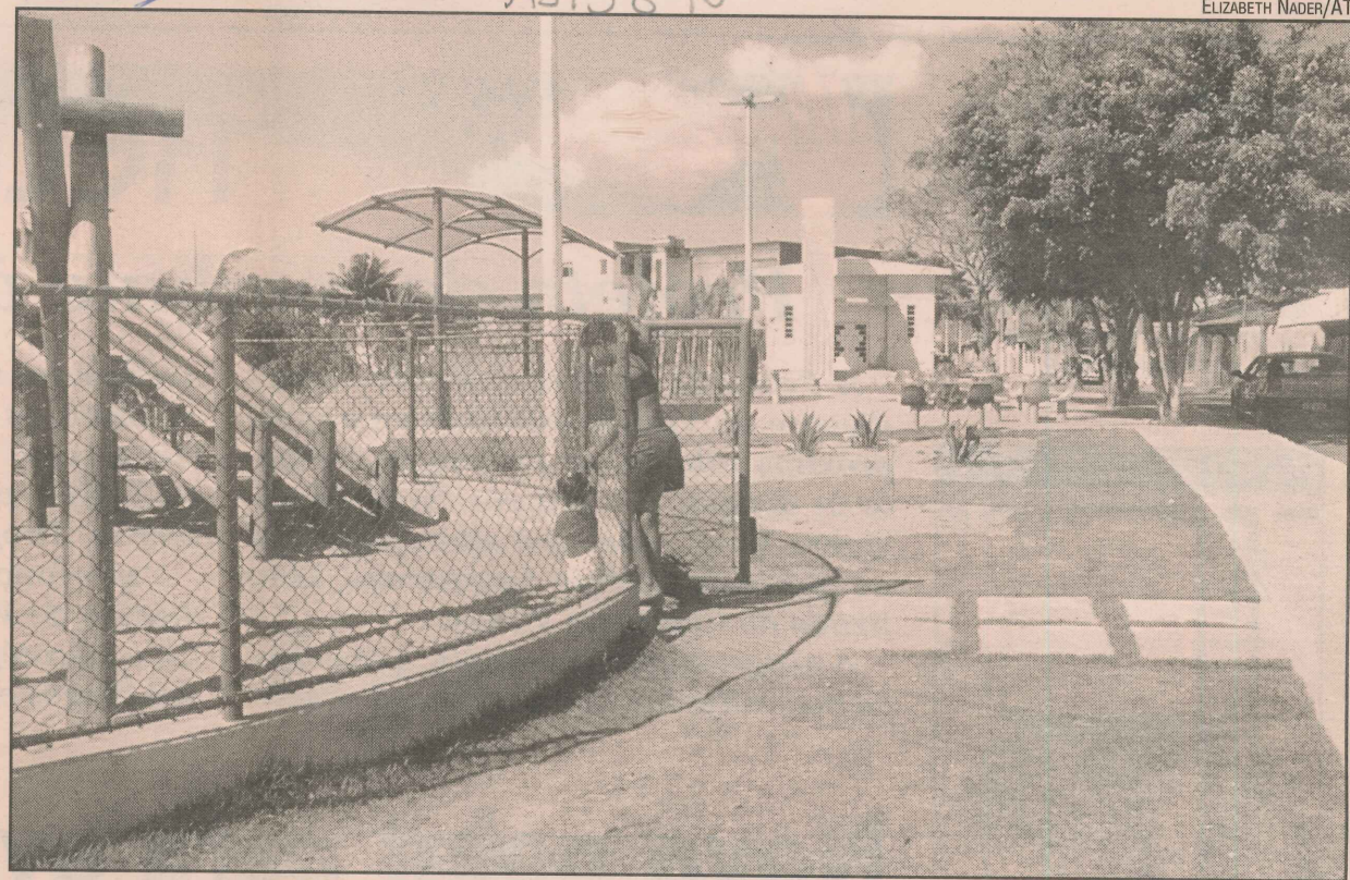
A pracinha, que começou a ser construída este ano, é opção para a criançada

“Lá em Brasília, onde eu morava, não tinha nenhuma pracinha por perto. Só nos finais de