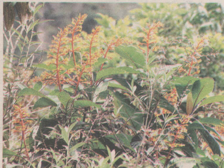
Flor da goiapaba, planta que dá nome ao parque

laboratório onde são produzidas mudas para o reflorestamento do local. “É um laboratório de micro-propagação vegetal, com capacidade de desenvolver, ou seja, clonar, diversas variedades vegetais, para serem fornecidas aos produtores rurais do município”, explica.