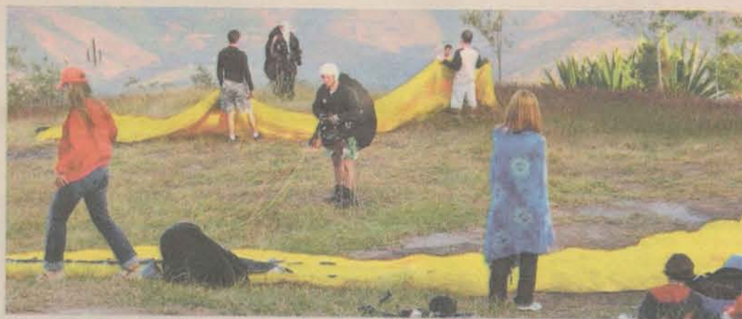
Atividades como vô livre e outros esportes radicais podem ser desenvolvidas em Goiapaba-açu, que tem uma altitude de 800 metros

A partir do Parque de Goiapaba-açu, estão sendo construídos, com parceria da Petrobrás, alguns trechos que dificultavam a subida, para facilitar o acesso