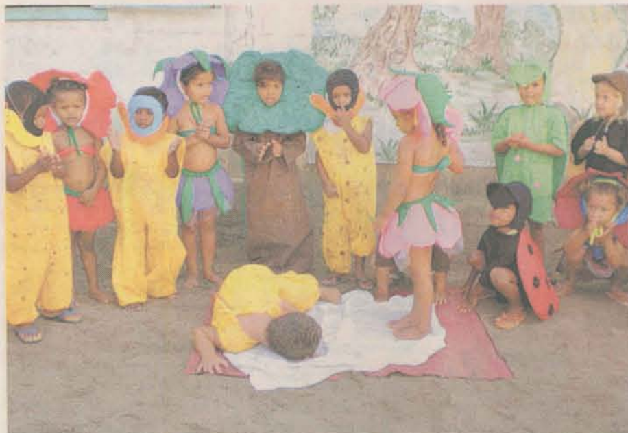
As crianças realizam atividades como teatro infantil e outras, visando a melhorar os seus conhecimentos culturais