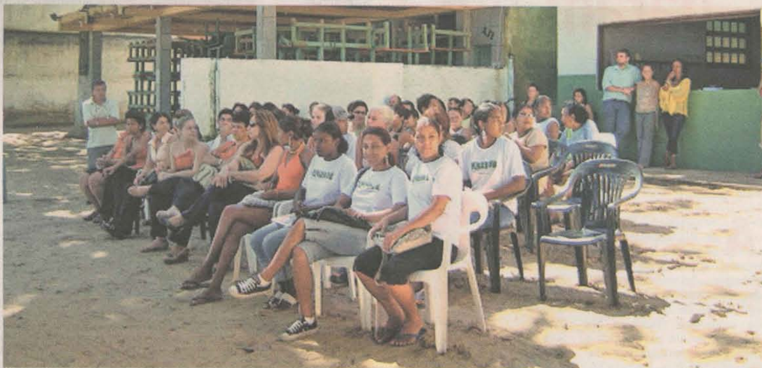
O funcionamento do Centro de Referência de Assistência Social (Cras) e o Programa de Atendimento Integral à Família (Paif) fazem parte das atividades de atendimento da Secretaria de Promoção Social

Já o serviço desenvolvido pelo Paif funciona através de uma rede básica de ações articuladas com oficinas de geração de renda e promoção social, grupos de atenção, curso de alfabetização e ação de documentação e cidadania.