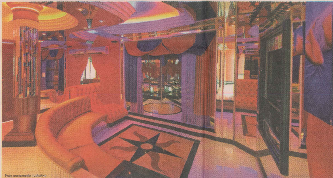
Foto meramente ilustrativa.

A alternativa valeria caso a Agência Nacional do Petróleo (ANP) não consiga concluir até julho a auditoria sobre as áreas do pré-sal que podem ser utilizadas na cessão onerosa. Segundo uma fonte próxima ao processo, a Petrobras poderia ir a mercado fazer sua capitalização, incluindo no valor total o montante a ser pago futuramente pelos barris a serem repassados pela União numa eventual cessão onerosa.