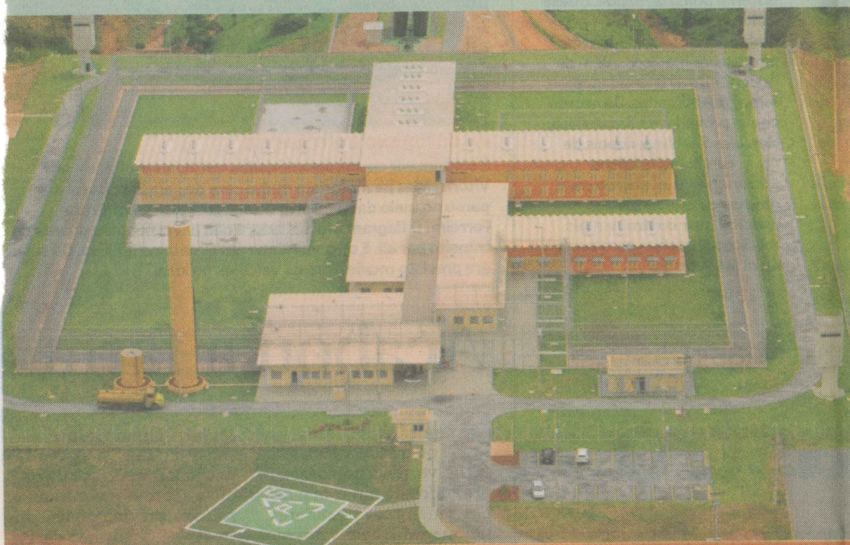
CDP de Guarapari - inauguração hoje, às 10h.

São 10 unidades prisionais entregues nos últimos dois anos pelo Governo do Estado. Método construtivo, equipamentos e modelo de gestão dentro dos padrões mais modernos do mundo.