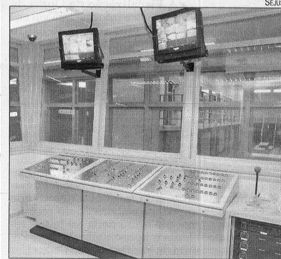
Sala de controle de imagens: segurança

De 2006 a 2008, os suicídios cresceram 40% (de 77 para 108), se somados os dados de todas as cadeias brasileiras. A proporção de suicidas é quase cinco vezes maior nas cadeias e delegacias do que do lado de fora.