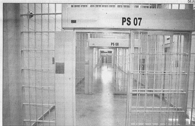
Portas da detenção terão raio X e detector de metais